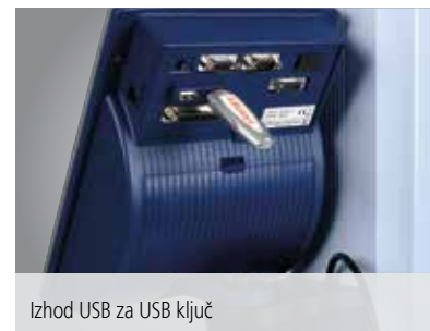
Izhod USB za USB ključ

Jasna kontrolna plošča z menijem vgrajenim v zaslon